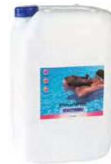
▶ LIMPIEZA, FLOCULANTES Y ACCESORIOS