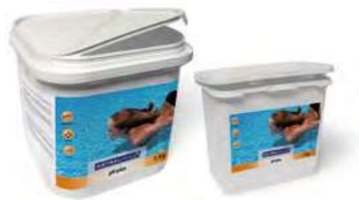
SOLUCIÓN ASTRALPOOL pH Plus Sólido