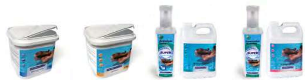
DESINFECCIÓN y MULTIFUNCIÓN