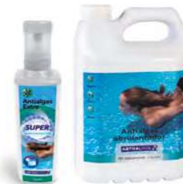
SOLUCIÓN ASTRALPOOL Antialgas Concentrado Líquido