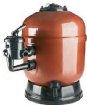
Filtro laminado AstralPool Signature